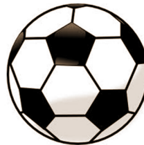
Ahtá·naw Λ né· kaʔi·k á