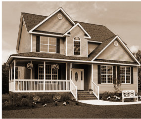
Kanuhsoteʔ né· kaʔi·k á