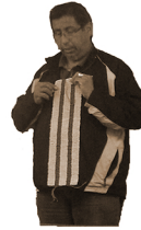
Lu·kwé né· kaʔi·k á