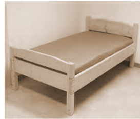
Ka·nákteʔ né· kaʔi·k á