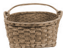
Ashé·nut né· kaʔi·k á