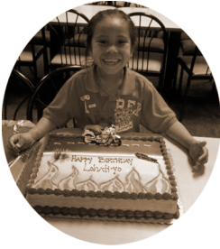
Laksá né· kaʔi·k á