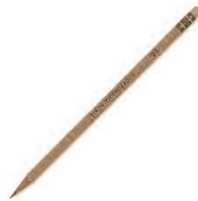
Yehyatúkhwaʔ né· kaʔi·k á