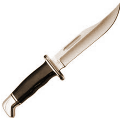
á·shaleʔ né· kaʔi·k á