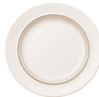
átsi né· kaʔi·k á