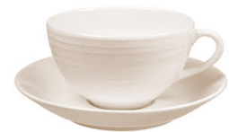
Teyuthneikutákhwaʔ né· kaʔi·k á