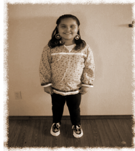
Yeksá né· kaʔi·k á