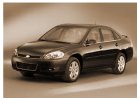
Ká·sleht né· kaʔi·k á