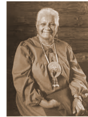
Yaku·kwé né· kaʔi·k á