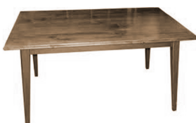
Atekhwalákhwaʔ né· kaʔi·k á