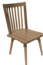
Anitskwalákhwaʔ né· kaʔi·k á