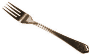
Aʔshékweʔ né· kaʔi·k á