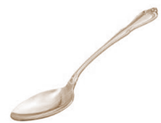
Atókwat né· kaʔi·k á