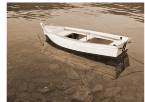
Kahuwe·yá né· kaʔi·k á