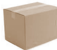
Kanutó·tsliʔ né· kaʔi·k á